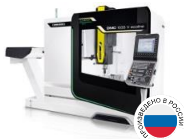
DMC 1035 V ecoline