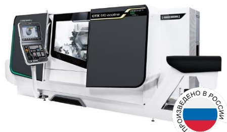
CTX 510 ecoline