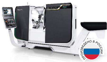
CTX 310 ecoline