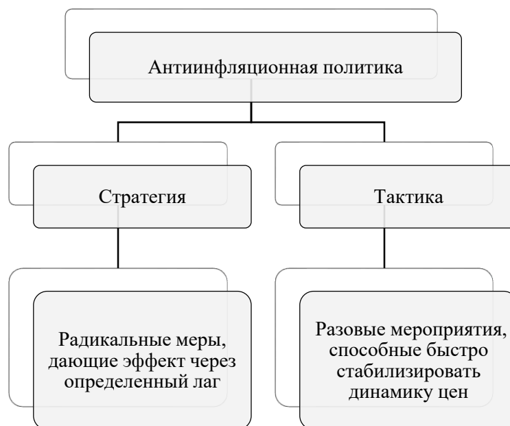
Рисунок 3 – Виды антиинфляционной политики

Аналитический материал курсовой работы также может быть дополнен специальными иллюстрациями, к которым относятся рисунки, схемы, диаграммы и т.п. Все иллюстрации обозначаются единым словом «Рисунок». Иллюстрации при необходимости могут иметь наименование и пояснительные данные (подрисуночный текст). Слово «Рисунок», его номер и через тире наименование помещают после пояснительных данных и располагают в центре под рисунком без точки в конце. Допускается нумеровать иллюстрации в пределах главы курсовой работы. В этом случае номер иллюстрации состоит из номера главы и порядкового номера иллюстрации, разделенных точкой (например, Рисунок 2.1). При ссылках на иллюстрации в тексте курсовой работы следует писать «... в соответствии с рисунком 3». Не допускается сканирование из других работ или учебников иллюстративных материалов, за исключением особо сложных графиков и т.п.